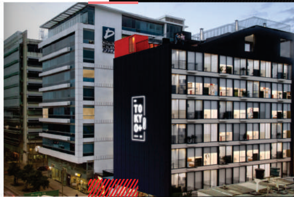
Redes Contra Incendios

Diseño de Instalaciones Interiores Hidráulicas, Sanitarias, Manejo de Aguas Lluvias, Red Contra Incendio y Redes de Gas Natural.