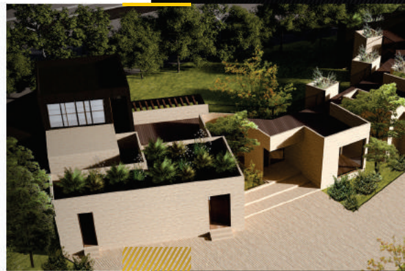
Redes de Gas Natural

Diseño de Instalaciones Interiores Hidráulicas, Sanitarias, Manejo de Aguas Lluvias y Redes de Gas Natural.